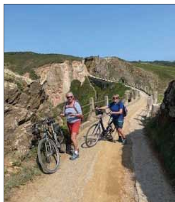
Sykkeltur på Sark.