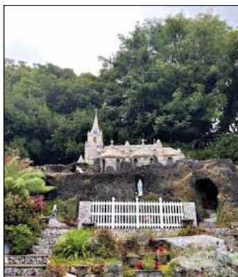
The Little Chapel.