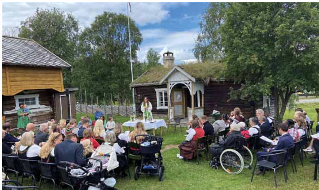
Gudstjeneste Dølmotunet 30. juni.