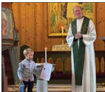
Fra spennende til vel langvarig ;-)