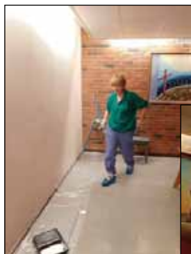
I gang med oppussingen. Foto: Turid og Rita.

Tekst/foto Turid Torbjørnsen og Rita Krogh