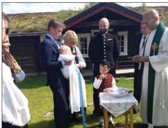
Bilde t.v.: Setermesse Tollefsvollen, Vingelen. Barnedåp.