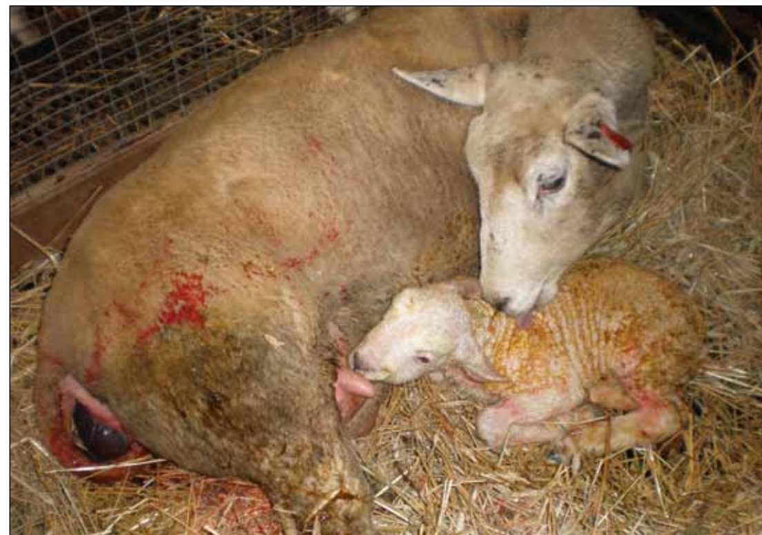
Vårens vakreste eventyr!