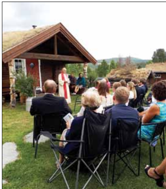
Setermesse på Dølvollen.