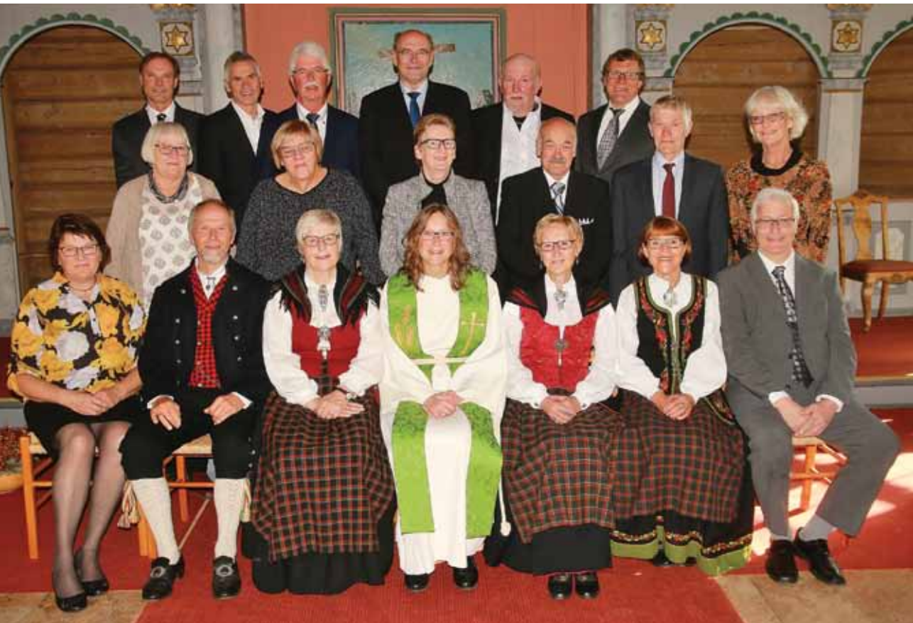
Årets femtiårskonfirmanter i Tolga Kirke.