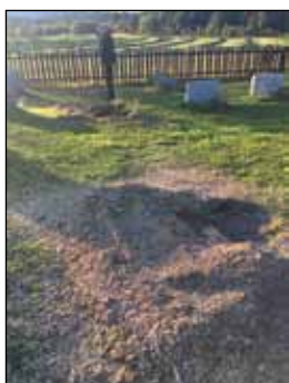
Frete stubber på kirkegården.