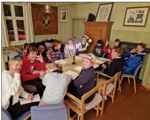
Konfirmantsamling i Vingelen menighetshus.