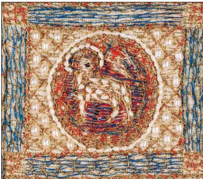
Lam på bispekåpe

Spørsmålet må ha vekka noe i dem. «Da husket de hans ord», står det. Det minna dem om det Jesus hadde sagt før han døde. Ja, de huska ikke bare ordene hans. Ordene satte dem i bevegelse. De gikk, de løp, de sprang – og de fortalte det til alle de andre.