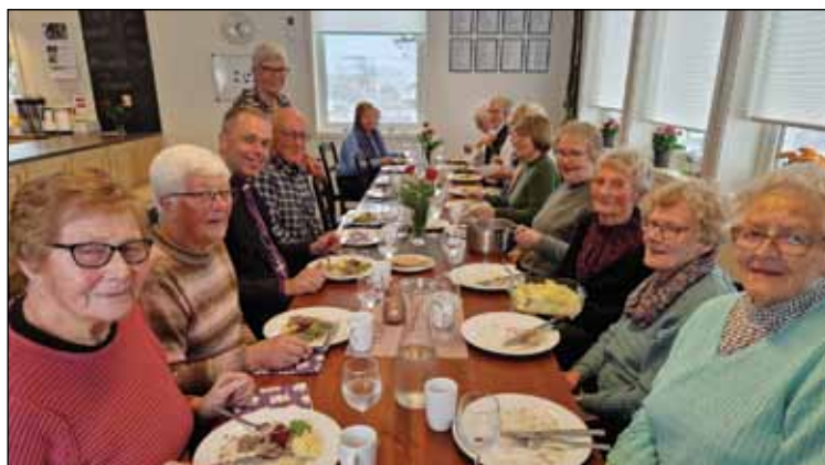
Lunsj med pensjonistene i Hamran.