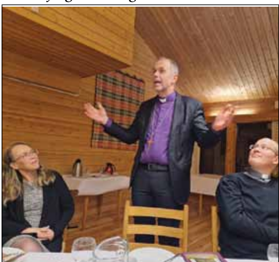
Fra Hodalen fjellstue.