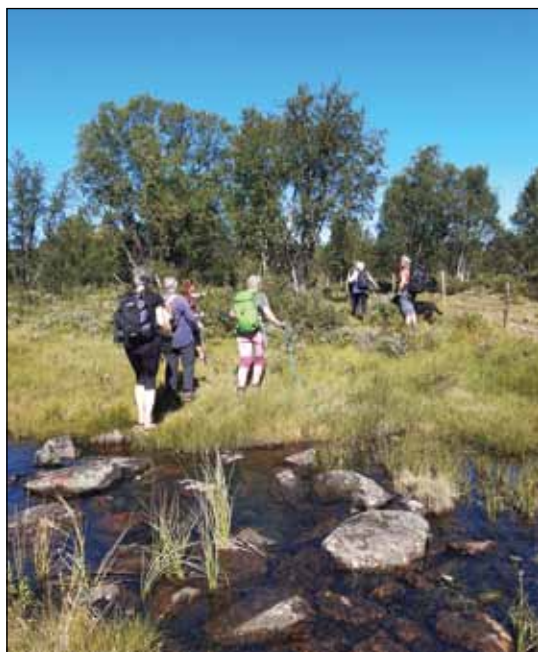
Ettersom turen gikk både på bløt sti og over bekker, valgte sistemann her å gå barføtt!