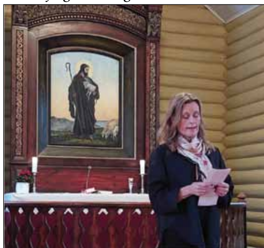
Vandringsgudstjeneste i Hodalen kirke.