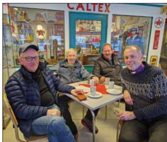
På Caltex.