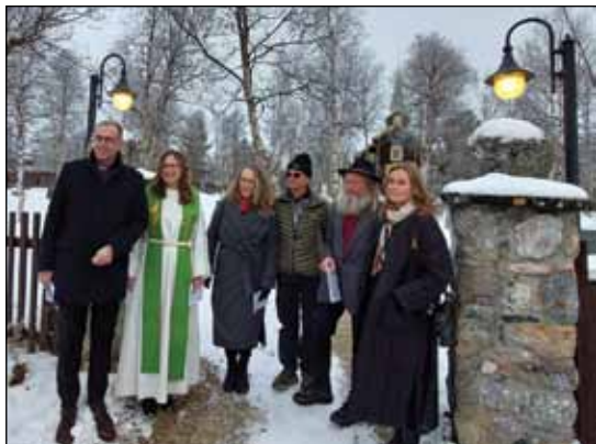
Vandringsgudstjeneste i Hodalen kirke.

I skrivende stund gjenstår Visitasgudstjenesten i Tolga kirke 19. november.