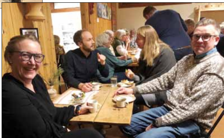
Kveldsmat i Vingelen kirke- og skolemuseum.