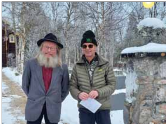
Vandringsgudstjeneste i Hodalen kirke.