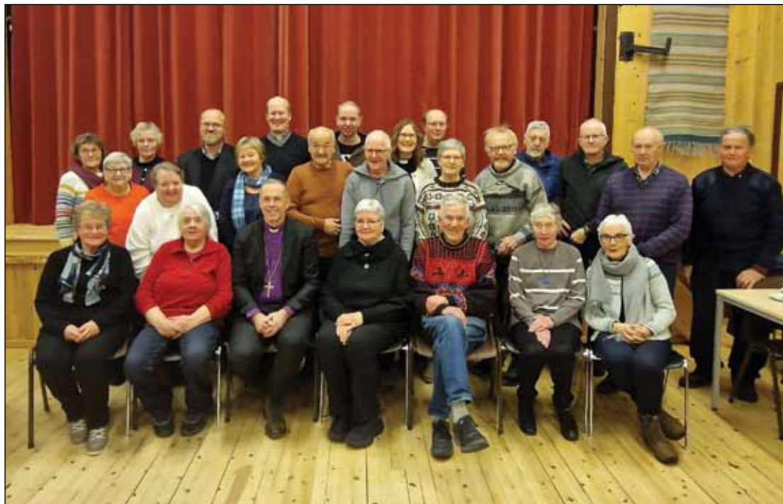
«Gjengen på loftet». Samfunnshuset i Øversjødalen.