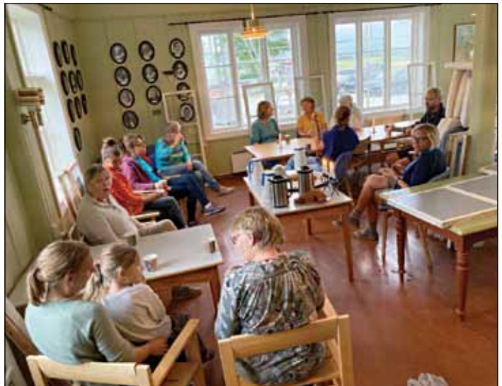
En pust i bakken etter ei lang økt.

Det ble som et nytt hus! Tusen takk til alle om bidro denne fine augustkvelden.