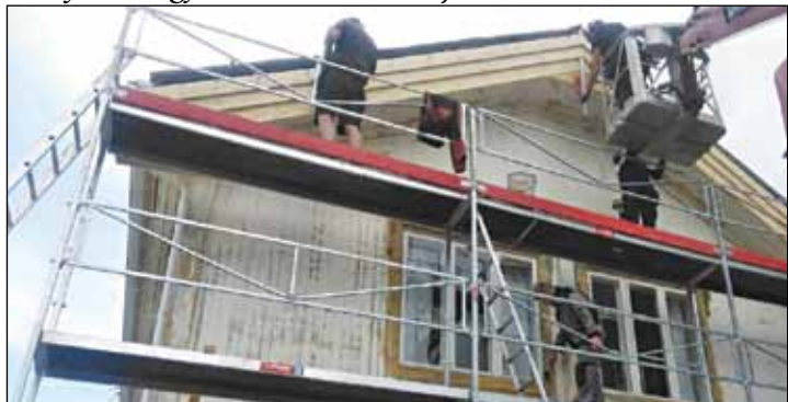
Høyt henger de, men sure er de neppe.