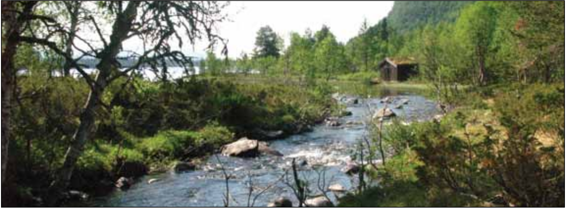
Leia passerer Øver Tolja ved Tallsjøen.