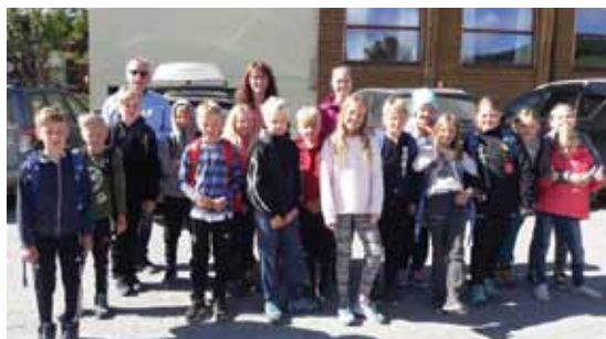
Venter på skysst bortpå Åsen.

Det var strålende turvær og vi hadde med oss spreke og blide elever - en riktig fin junidag!