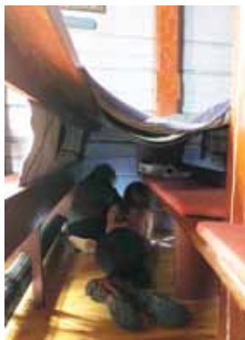
Tårnagenter under teppet.