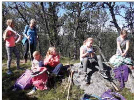
Elevene spikka hver sin pilgrimsstav i løpet av turen!