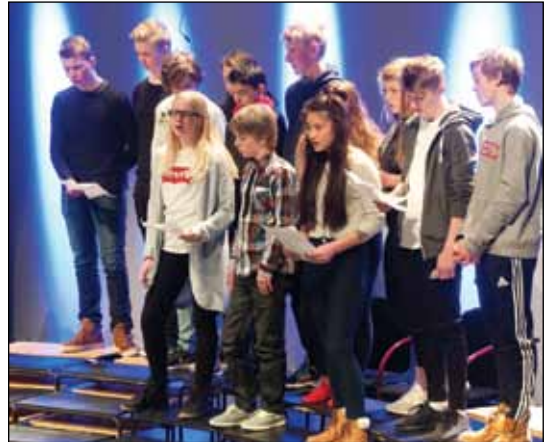
Fra salmekonserten i Kulturhuset på Tynset.