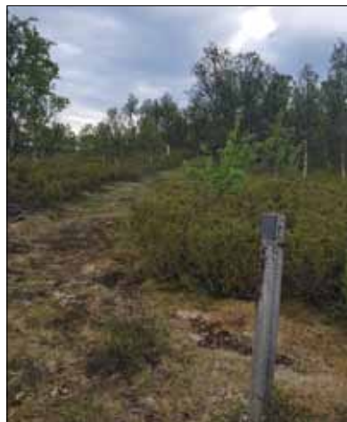
Pilegrimsleia over «Allmannhaugen» med merkestolpe.

Det blir stopp underveis, ta med drikke og «noe å bite ti». Det er også salg av mat og drikke på Dølvollen. Når det gjelder skyss, kan en sjølsagt kjøre sjøl, eller møte på Malmplassen eller Bua i Vingelen kl. 9.00 for samkjøring. Skiltet parkering ved Østvangen. Det blir organisert henting av biler etter setermessa.