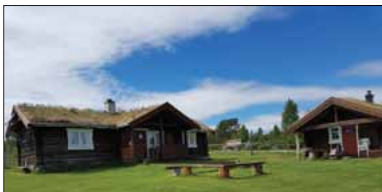
Dølvollen hvor pilegrimsvandringa ender, og alle samles til setermesse.

Veien svinger seg videre gjennom frodig barskog frem til Toljeelva som forbinde Øvre og Ytre Tallsjøen. Vadet er grunt,