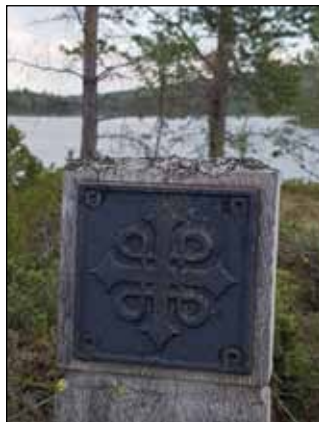
Symbol for Pilegrimsleia.