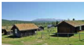
Setermesse på setra til Trond Erlien.

Søndag 29.07. kl. 19.00. Konsert med Sneppen. Tolga.