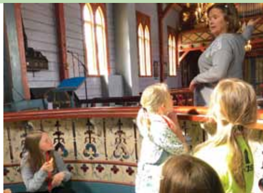
Tårnagenter i alterringen.

en meget vellykket dag som vi gjerne gjentar neste år også.