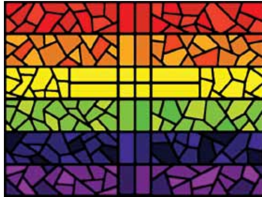
“Stained-glass Rainbow Flag with Cross” av Andrew Craig Williams.

Den nye dåpsliturgien vi har hatt de siste årene har nå vært til revisjon. Noen små endringer er gjort og i løpet av året vil vi ta i bruk denne nye dåpsliturgien. Så følg med i tiden som kommer og se om dere legger merke til endringene!