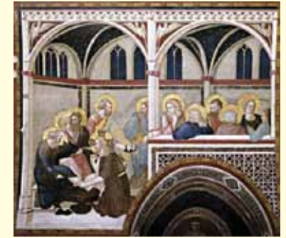
Maleri av Pietro Lorenzetti i Basilica inferiore di San Francesco d'Assisi.

Kirken ligger i mørke når vi kommer. Bare et enkelt lys i våpenhuset og på alteret. Påskelyset bæres inn til ordene KRISTUS VERDENS LYS. Fra det tenner alle sine lys og stående hører vi påskelovsungen synges og tekster leses. Den siste