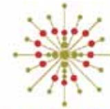
STØRST AV ALT nattesøvn.

Tur opp i tårnet ble det også tid til. Det var spennende å klatre opp på loftet og videre opp i tårnet hvor klokken hang. Det er god utsikt fra tårnet i Tolga kirke – selv klokken 12 om natten! Vel nede i kirkerommet igjen, kom soveposer og pyjamas frem. Det å overnatte i en 176 år gammel tømmerkirke var spennende for mange. Men det å ligge der i tussmørket og lytte til vinden, knirkingen i tømmeret og lydene i det gamle huset ga oss en god