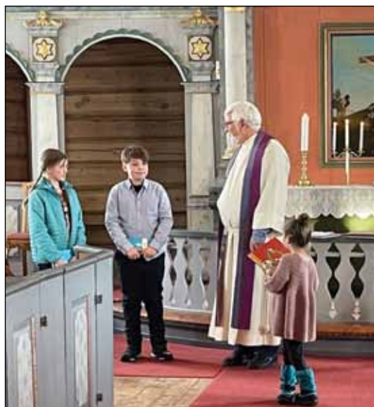
Utdeling av NT til 11 åringer samt bok til 4 og 6 åringer i Tolga kirke 13.mars.