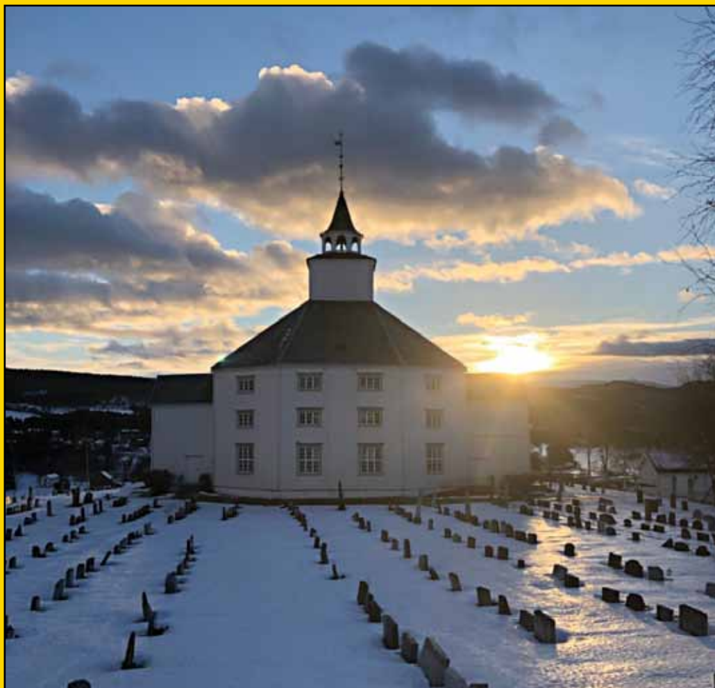
Tolga kirke.

Menighetsblad for Tolga, Vingelen, Hodalen og Holøydalen sogn