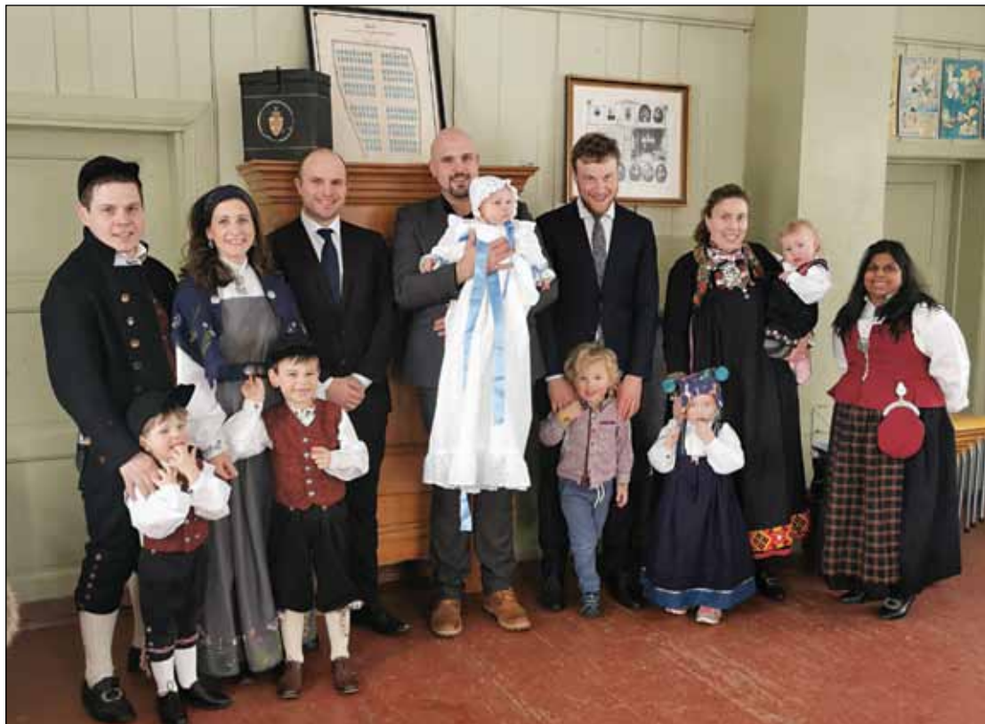
Dåpsfølge i Vingelen 6.mars.