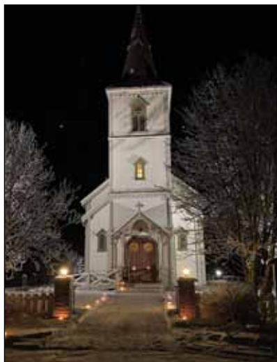
Vingelen kirke var pyntet til fest ved innsyng av jul 2020. Tusen takk til menighetsrådet.