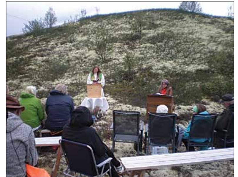
Friluftsgudstjeneste i Hodalen.

Stunda ble avslutta med kaffe og fersk bakst i 4H sin lavvo. Med fyr i ovnen ble det rett så trivelig for hunder, kaniner, me- nighet, organist og prest.