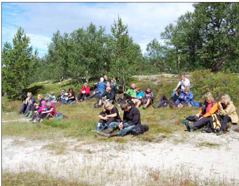
Matpause i strandkanten.