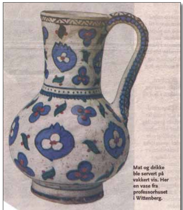
Mat og drikke ble servert på vakkert vis. Her en vase fra professorhuset i Wittenberg.

Utstilling – og bok – gir et bilde av Luthers hverdagsliv, skriver aviser (”Vårt Land”, 7.11.2009).